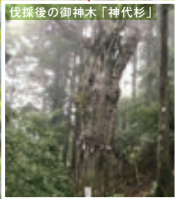
玉置古道として美しい溪流沿いの松平参詣道は伐採によって景観は大きく損なわれている